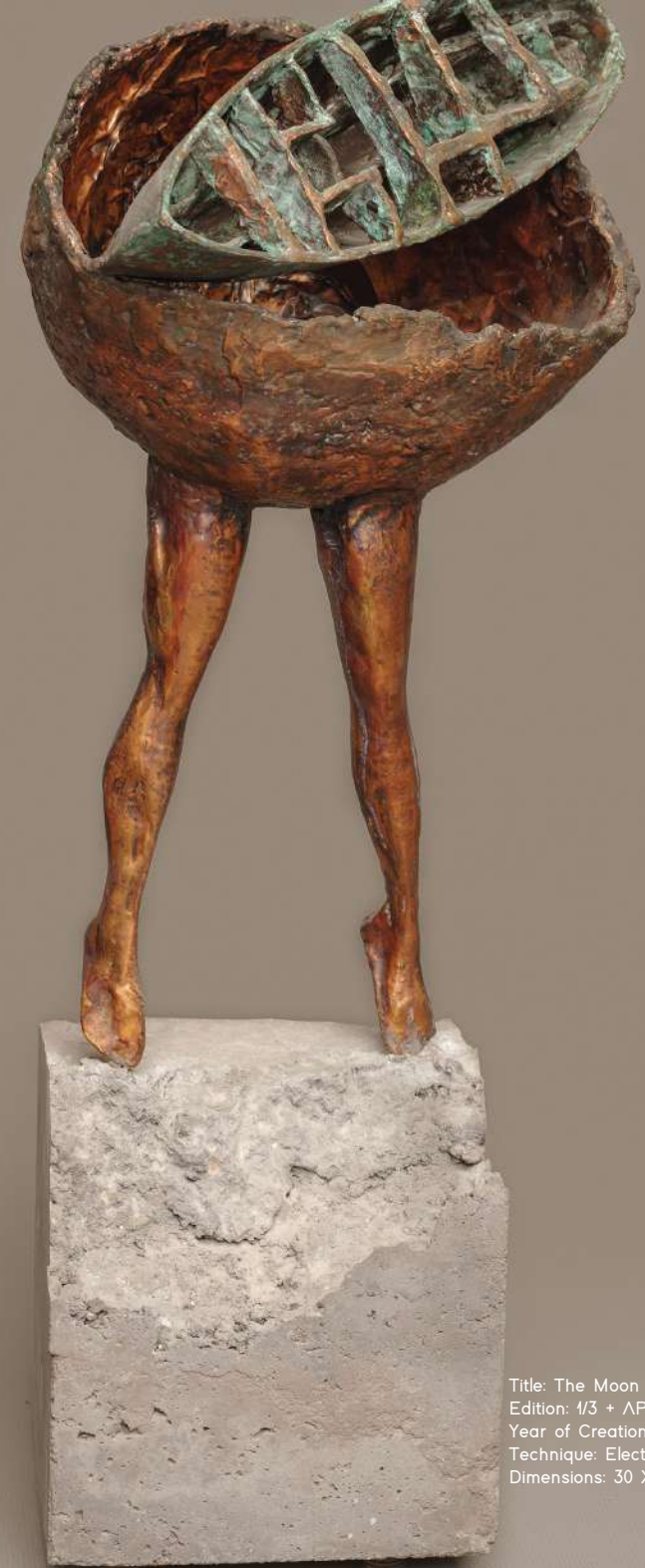
Title: The Moon Turned from The Alley Edition: 1/3 + AP Year of Creation: 2019 Technique: Electroforming Dimensions: 30 X 30 X 70 CM