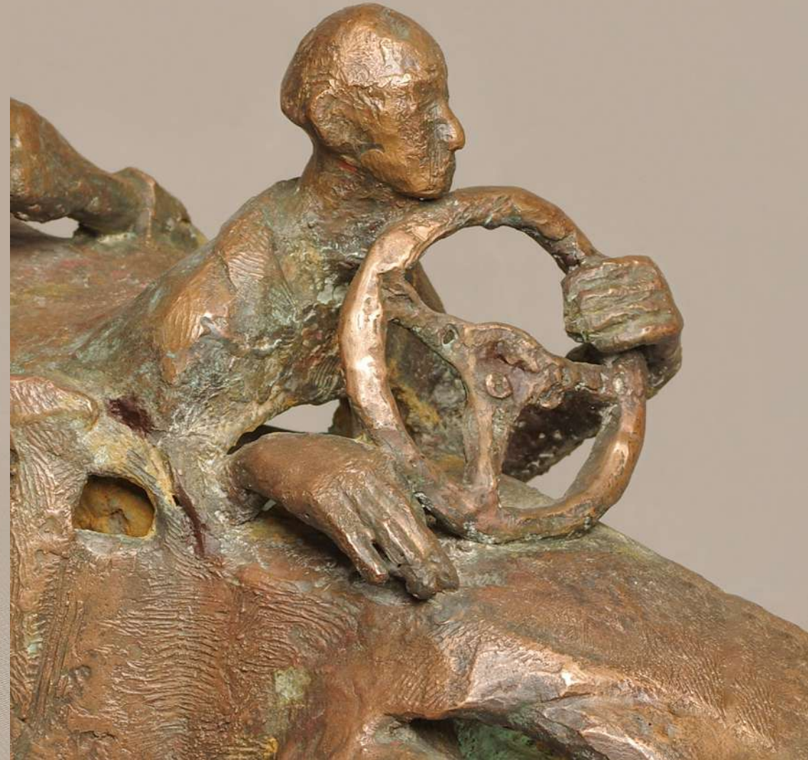
Title: Before Us Edition: 1/3 + AP Year of Creation: 2016 Technique: Bronze Dimensions: 30 X 45 X 23 CM