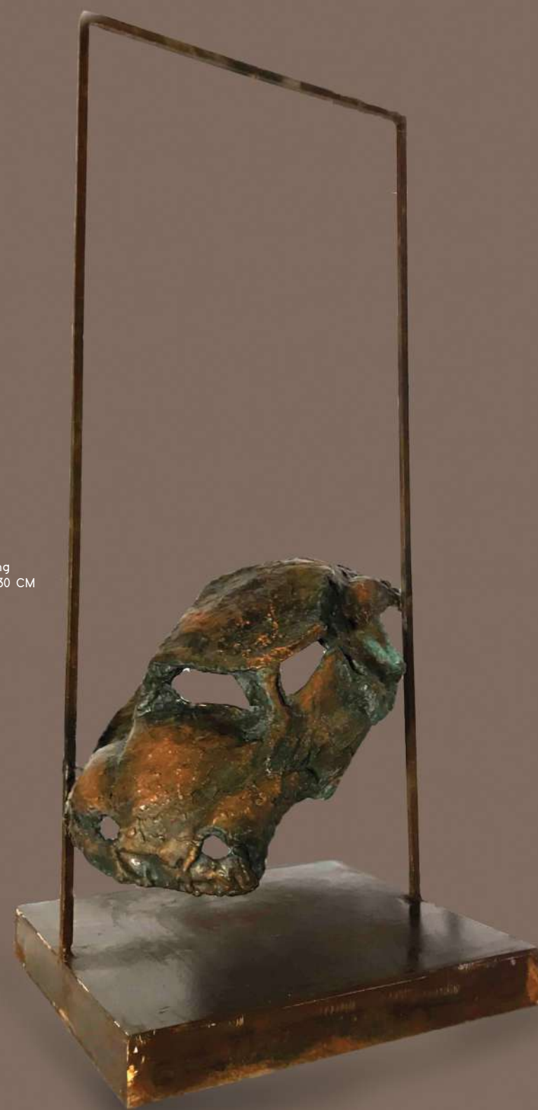
Title: I Drowned Edition: 1/3 + AP Year of Creation: 2020 Technique: Electroforming Dimensions: 70 X 30 X 30 CM