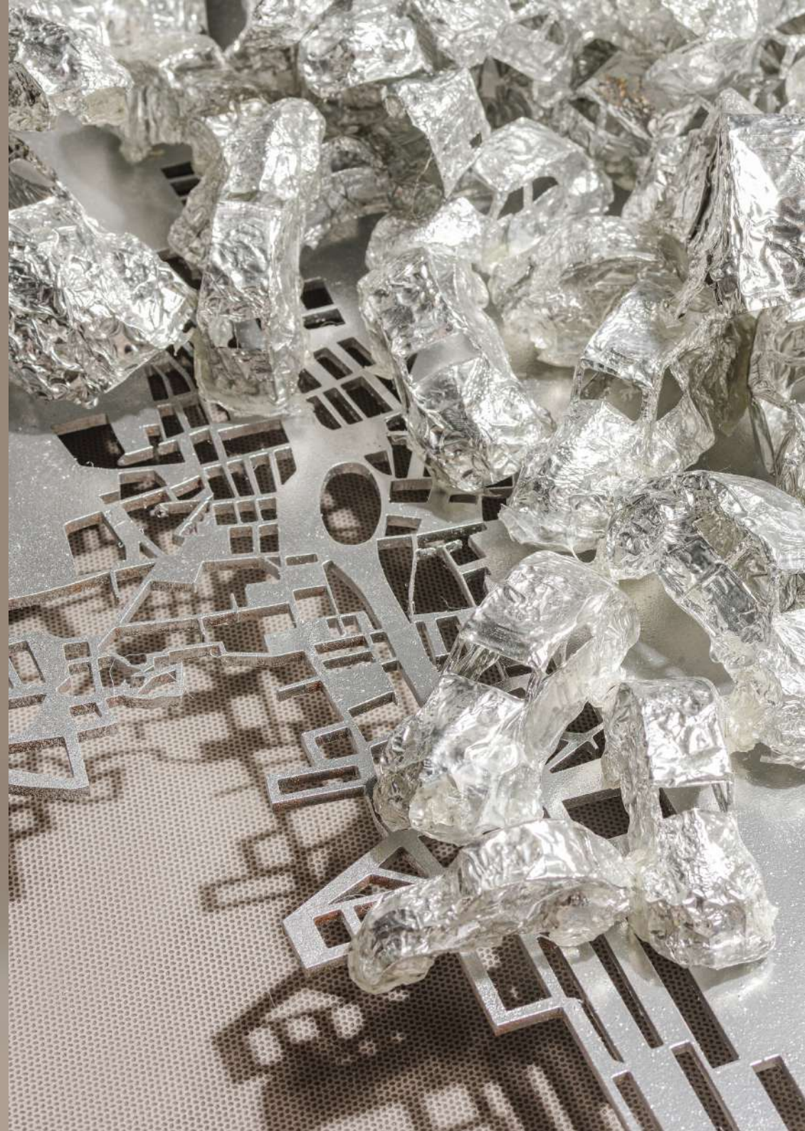
Title: Urban Echoes Edition: 1/3 + AP Year of Creation: 2023 Technique: Mixed Media Dimensions: 25 X 80 X 60 CM