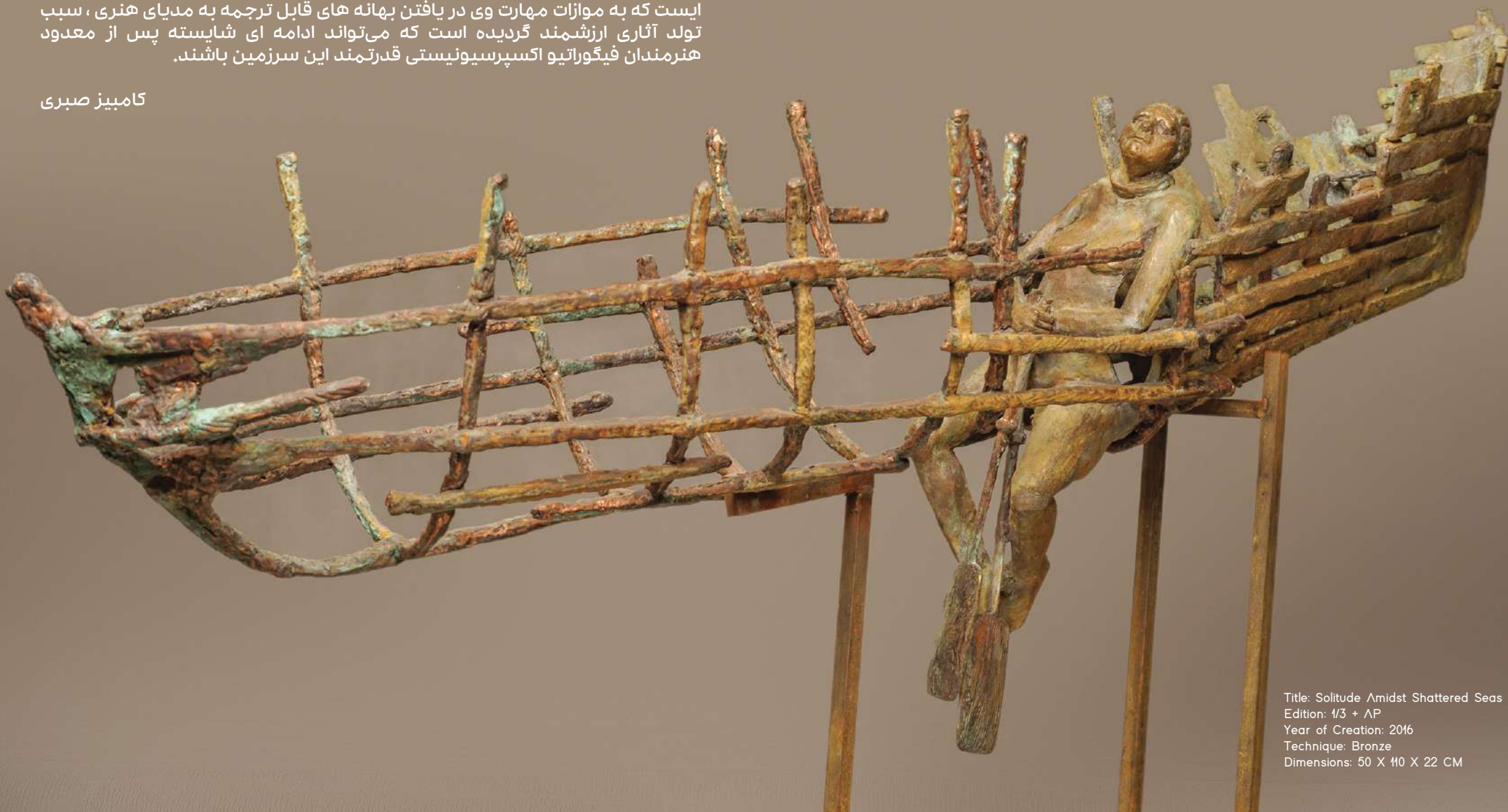
Title: Solitude Amidst Shattered Seas Edition: 1/3 + AP Year of Creation: 2016 Technique: Bronze Dimensions: 50 X 110 X 22 CM