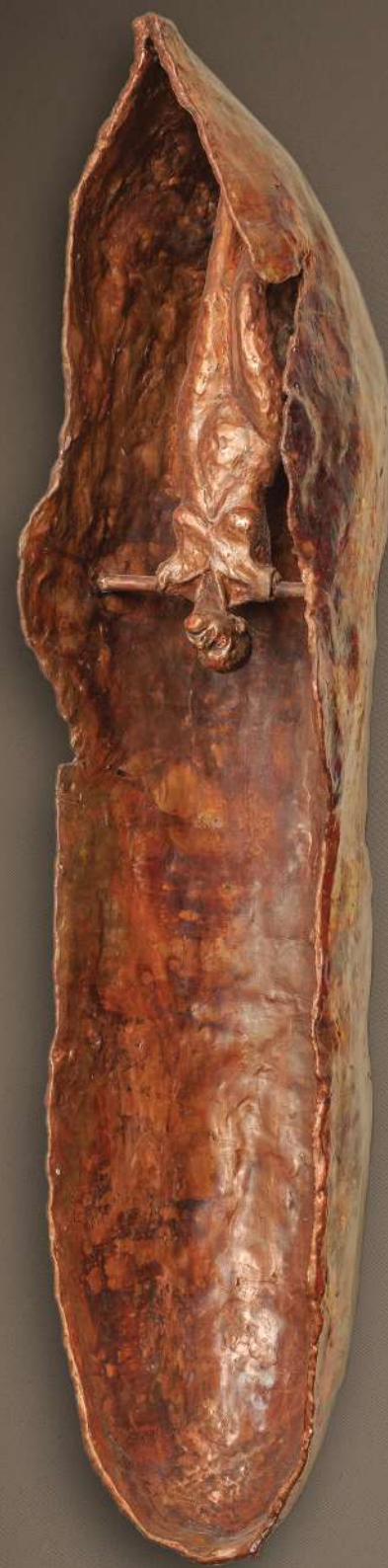
Series Title: Last Round Edition: 1/3 + AP Year of Creation: 2019 Technique: Electroforming Dimensions: 30 X 100 X 30 CM