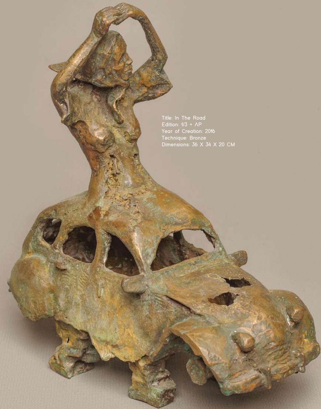
Title: In The Road Edition: 1/3 + AP Year of Creation: 2016 Technique: Bronze Dimensions: 36 X 34 X 20 CM