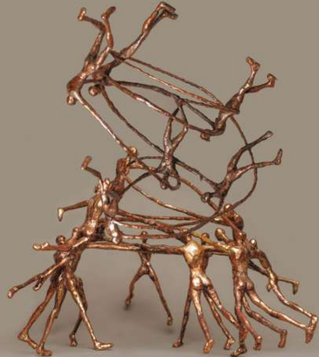
Title: All Around The World Not Surrounding My Souls Edition: 1/3 + AP Year of Creation: 2022 Technique: Electroforming Dimensions: 80 X 55 X 55 CM